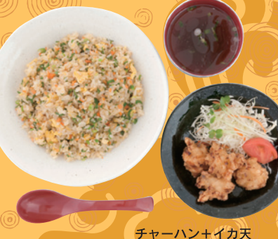
チャーハン+イカ天